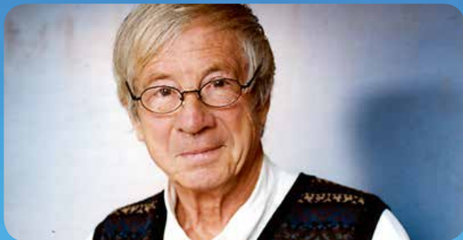
Spectacle de Jean-Louis FOURNIER